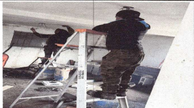
Foto 2: Cambio de Instalacion electrica, accesorios e iluminación.