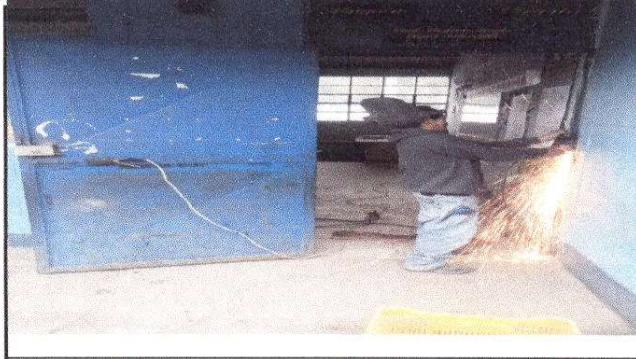
Foto1: Instalacion de chapas en puertas de aulas.